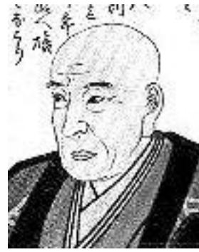
うたがわひろしげ