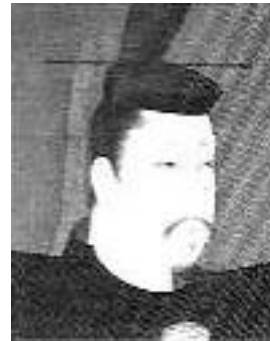
みなもとのよりとも