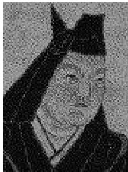
うえすぎけんしん