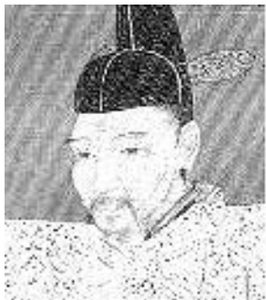
とよとみひでよし