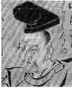
ちかまつもんざえもん