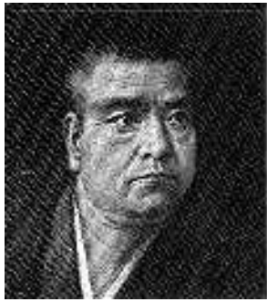
さいごうたかもり