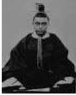
とくがわよしのぶ