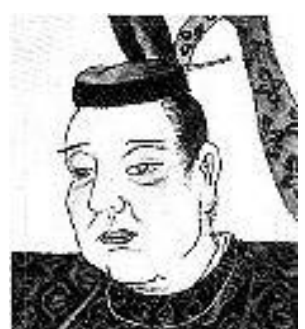
とくがわいえみつ