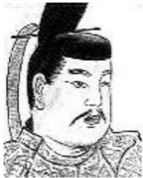
しょうむてんのう