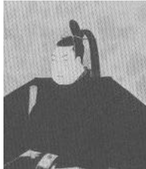
とくがわ つなよし