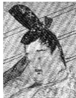
ふじわらみちなが