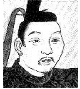
あしかが よしまさ