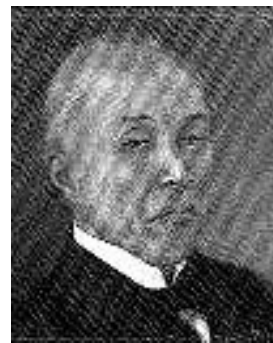
おおくましげのぶ