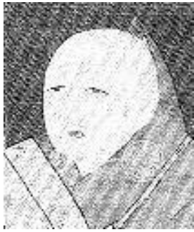
あしかがよしみつ