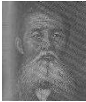
いたがきたいすけ