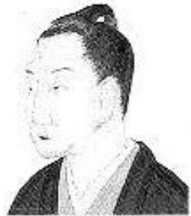
もとおりのりなが