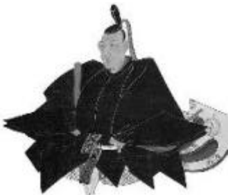
とくがわよしむね