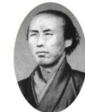
さかもとりょうま