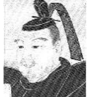
とくがわ いえやす