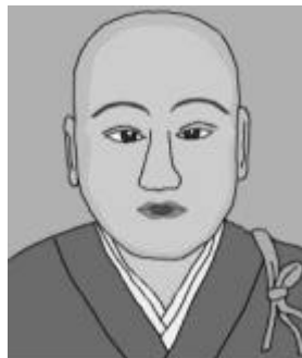
ほうじょうまさこ