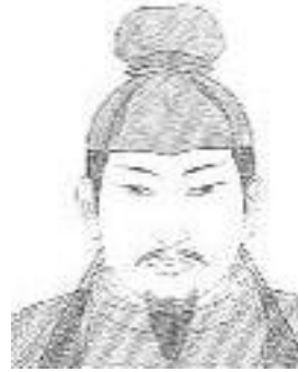
なかのおおえのおうじ