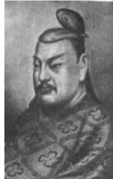
すがわらみちざね