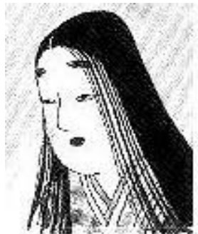
せいしょうなごん