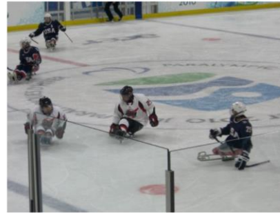
パラアイスホッケー(旧アイススレッジホッケー)